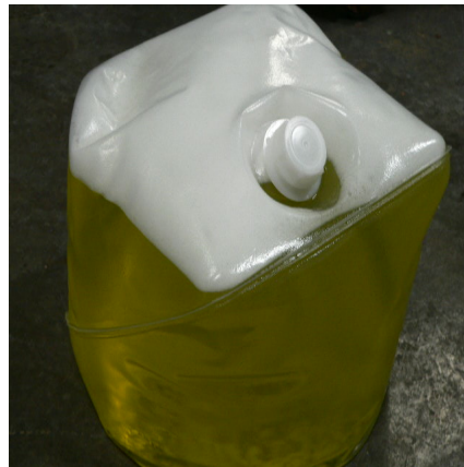
図1-2. 消火器用消火薬剤