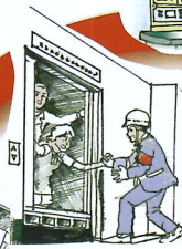
エレベーター閉じこめ救出